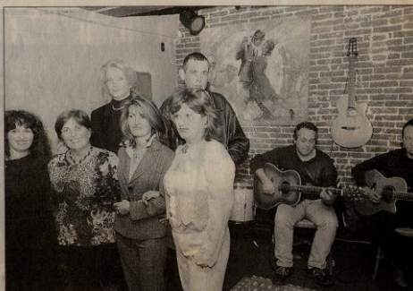
Le vernissage de l'exposition a eu lieu jeudi dernier en présence des artistes et des amateurs d'art