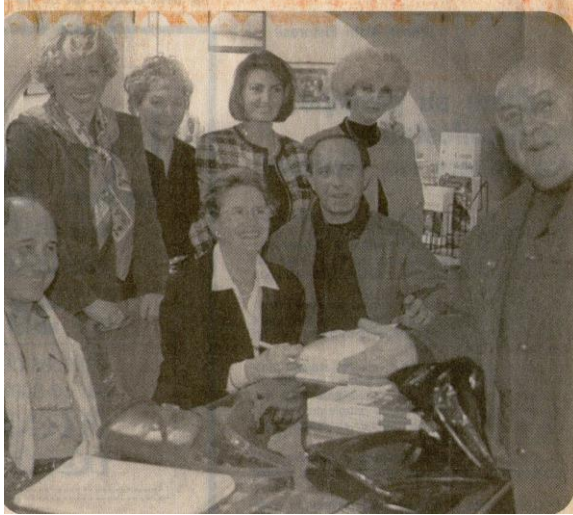
Le point de rencontre : pour artistes au pluriel.