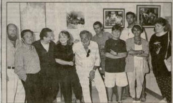
Une trentaine de peintres exposent leurs œuvres à « L'Araignée » durant une semaine. Hier, le public a pu découvrir leurs tableaux.

« Rues en Harmonies » Chantons et exposons sous la pluie !