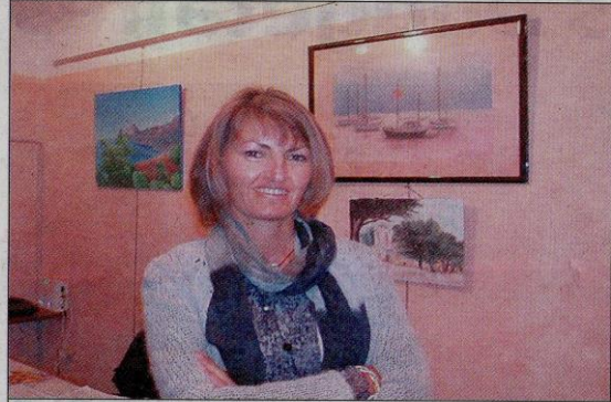
Valérie Dragacci a plus d'une corde à son arc : pastels, aquarelle, gouache, encre de chine...

Valérie Dragacci expose ses tableaux, du 16 octobre au 2 novembre, dans la salle de l'association U Pumonte, rue Colonel-Fieschi à Cargèse. L'artiste a plusieurs cordes à son arc. En fonction des tableaux, elle utilise les pastels, l'aquarelle, la gouache, voire l'encre de chine. Sur ses toi-