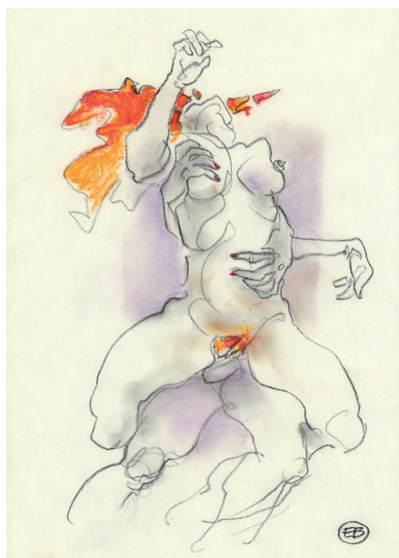
Le baiser, pastel 30x40cm