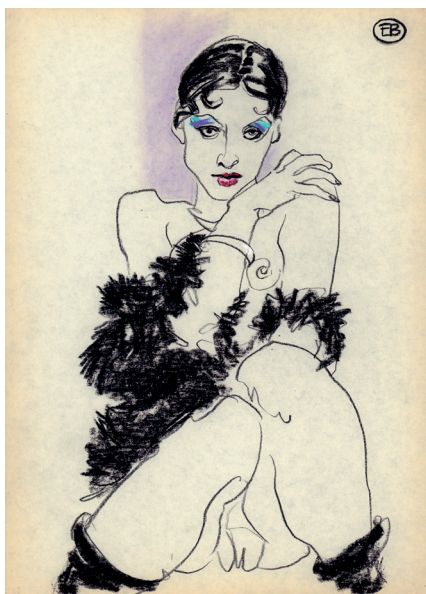
Alexandra, Pastel, 30x40cm

In 2015, the artist was nominated for a Golden Blog Award in the Art and Design category.