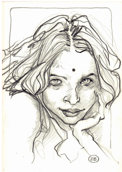
Nikki, Crayon, 20x30cm