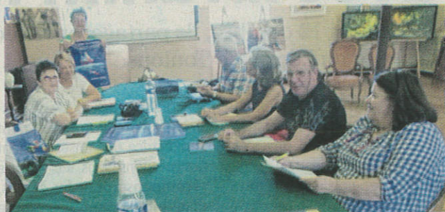
Présentation de l'affiche lors de la réunion de travail

La préparation du prochain Salon International de Peinture se poursuit. Les artistes présélectionnés et intéressés ont répondu par l'envoi d'un dossier. Récemment une réunion de travail a permis de faire un choix sur la centaine de dossiers reçus. Maintenant, les artistes retenus doivent faire parvenir les œuvres sélectionnées à la mairie en vue d'un nouveau choix.