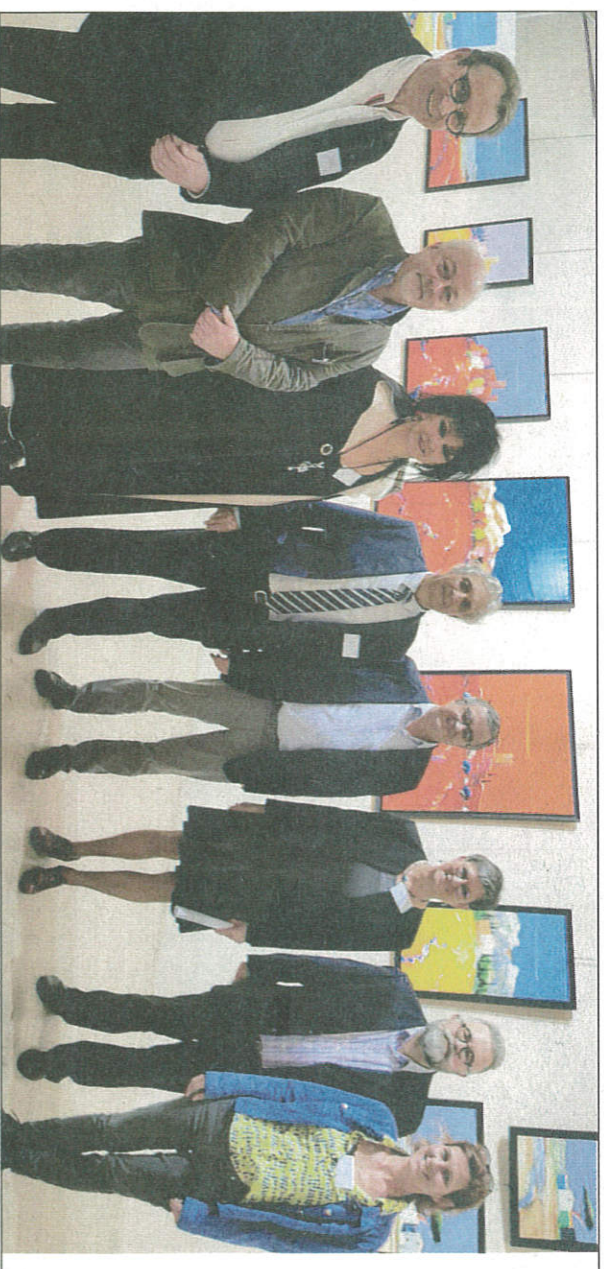
Les personnalités et artistes primés à l'issu des interventions officielles

30e salon de peinture de la ville de Clairac