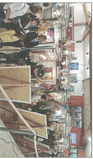
Vue générale du 30e salon de peintures de la ville de Clairac