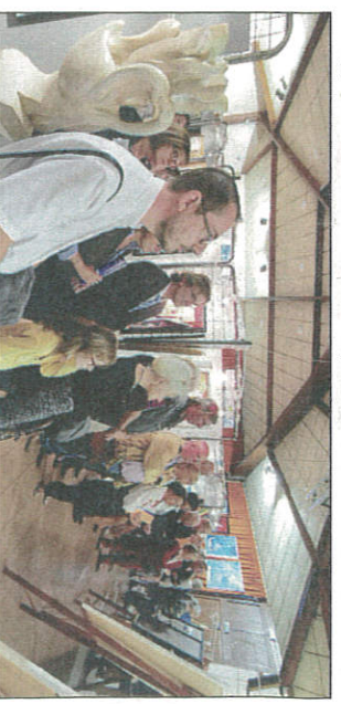
Les personnalités écoutent les discours d'inauguration