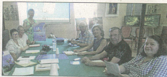
Les petites mains préparent la manifestation

Le salon international de peinture se prépare. Les artistes présélectionnés et intéressés ont répondu par l'envoi de leur dossier complet. Vendredi 20 septembre s'est déroulée une séance de travail au cours de laquelle ont été retenus un certain nombre d'artistes. Ils vont faire parvenir les œuvres sélectionnées à la