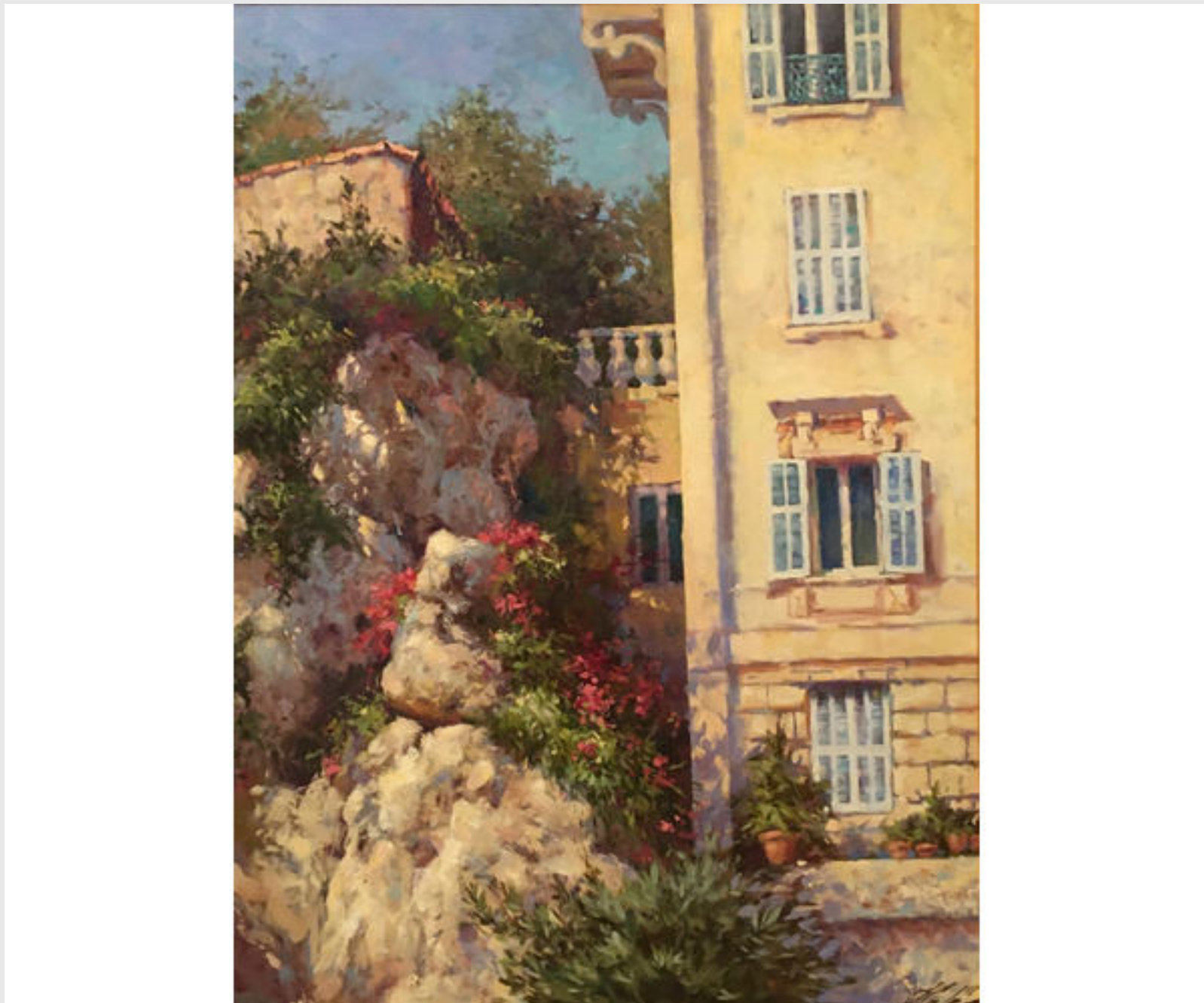
Метаморфозы Ниццы, 2018 г.

Несколько раз я ловила себя на ощущении «вхождения» в картину. Словно я погружаюсь в сюжет, и весь остальной мир пропадает. Эту возможность – замедлиться и полюбоваться моментом – начинаешь особенно ценить в эпоху непрерывающегося потока информации. В этом смысле картины Натальи Кахториной – идеальный портал в режим так называемой слоу-лайф (медленной жизни).