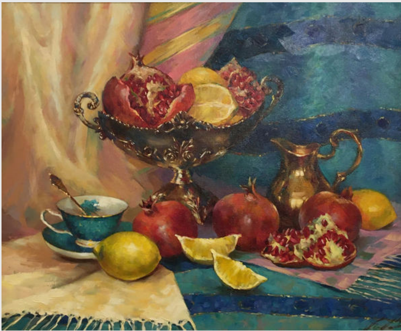
Лимоны и гранаты, 2018 г.