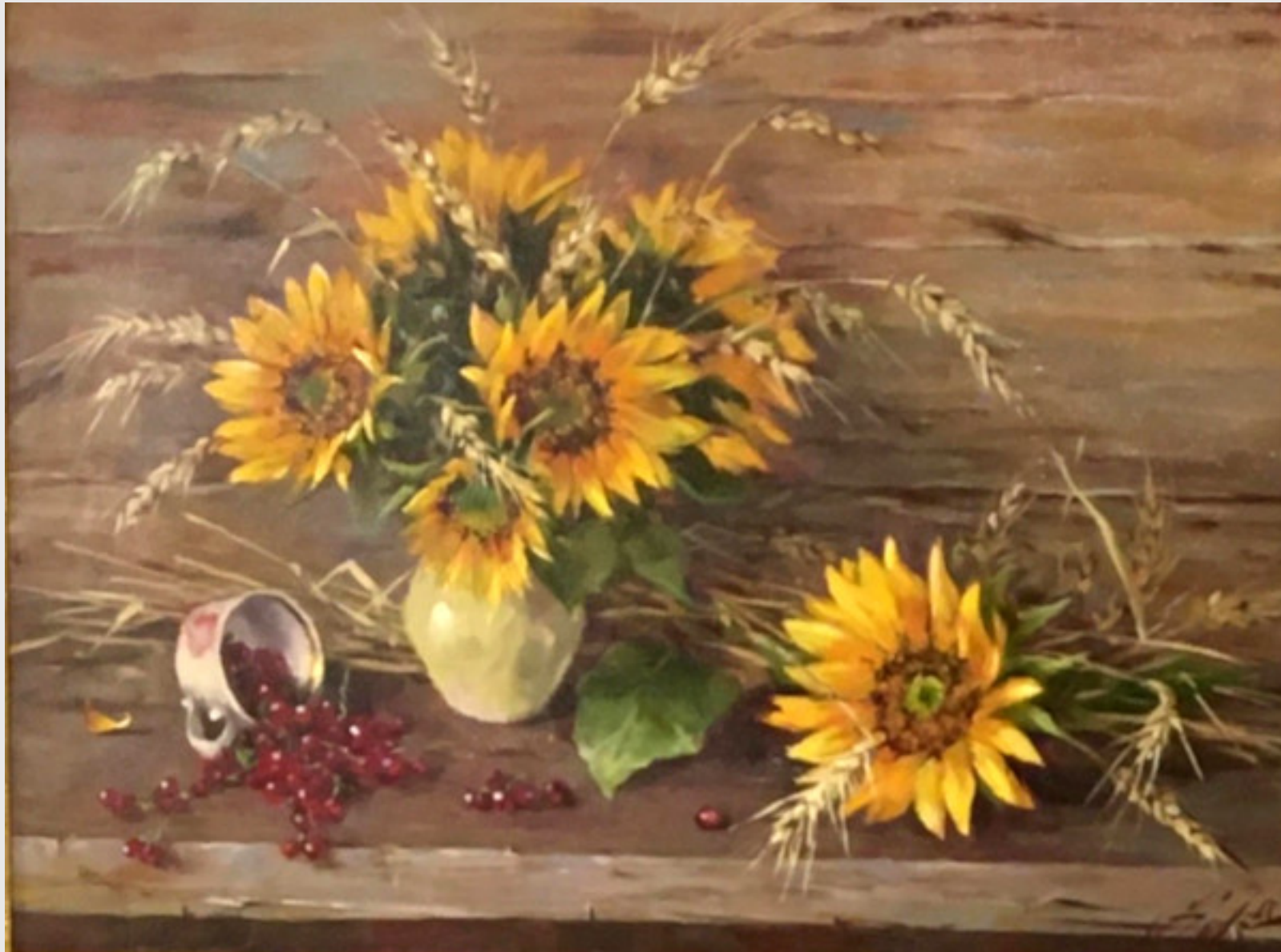
Подсолнухи, 2018 г.

«Львиная часть работ посвящена волжским мотивам, – делится она. – Каждые летние каникулы я проводила в Тольятти у бабушки, так что Волга – это мое место силы, там я набираюсь энергии».