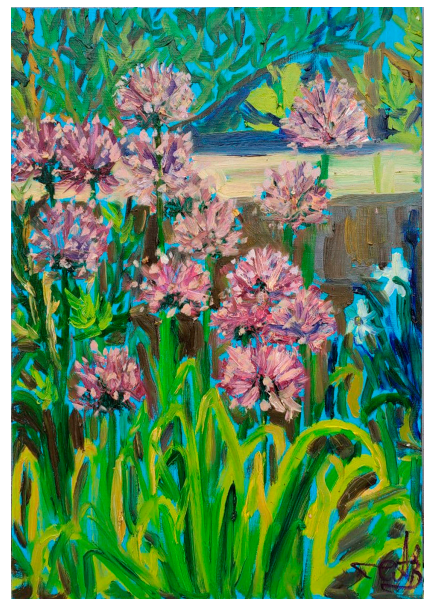
Алліум, п., о., 70x50, 2020 р.