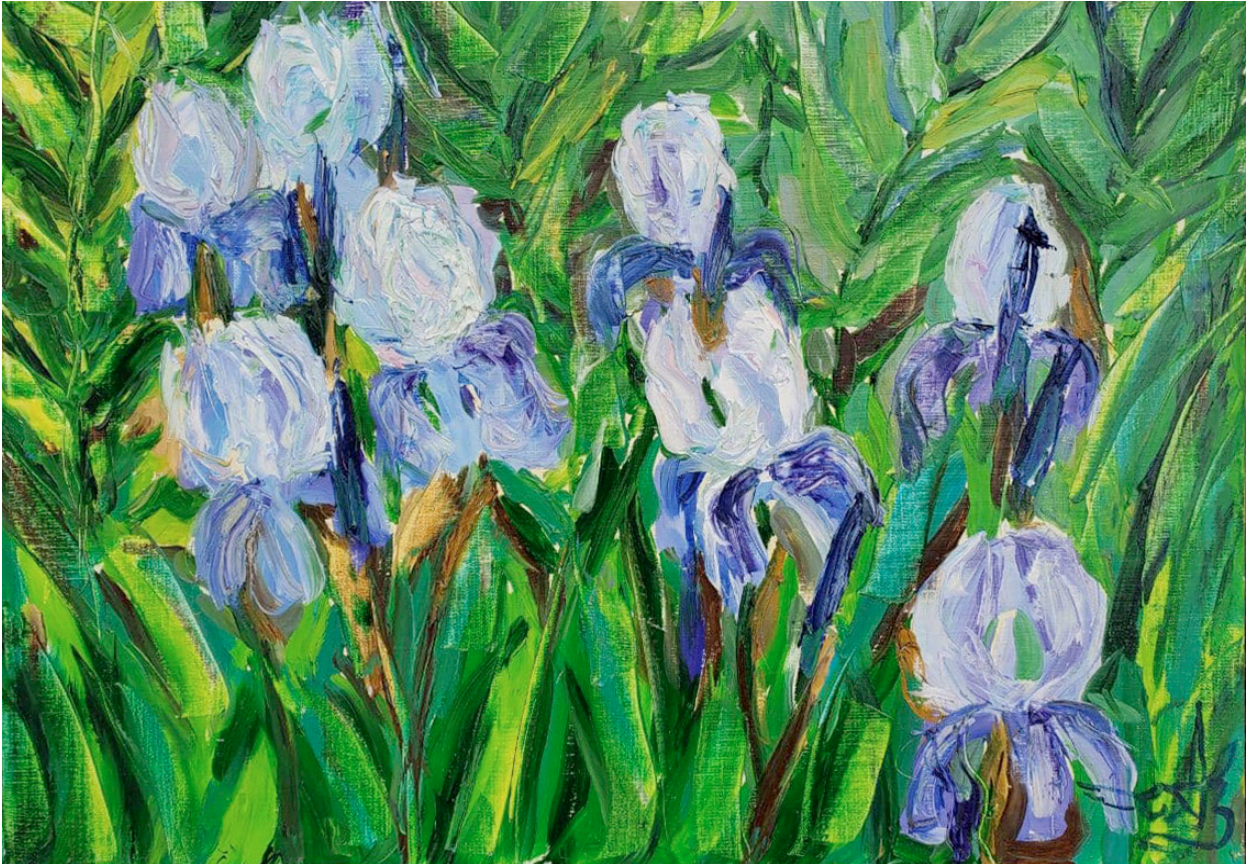
Сині іриси, п., о., 50x70, 2020 р.