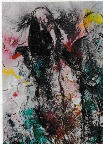
Sans titre 13 x 18 cm technique mixte

La deuxième étape va consister à trouver le secret que chacun a raconté dans ce premier jet pour ensuite le faire naître par le dessin. C'est alors une rencontre avec soi-même où les émotions sont souvent très fortes. Oser mettre des formes à ses rêves pour que ses rêves prennent forme. J'aide les élèves là où ils en sont sur leur chemin, sans jugement, avec leurs blocages et leurs contradictions, mais aussi avec leurs richesses intérieures qu'ils ne connaissent pas. On ne peut mentir car c'est l'inconscient qui parle. Ce qui se passe m'échappe et leur échappe aussi. La magie se montre et je deviens canal pour transmettre ce qui m'est donné afin d'aider chacun à se découvrir. Je me suis demandé longtemps pourquoi l'aquarelle s'est imposée à moi. Je sais aujourd'hui que l'aquarelle est une formidable école de vie qui