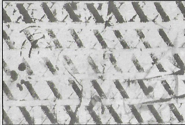
La répétition des X à l'obsession : l'anonymat et l'inhumanité des individus devenus les numéros d'une longue série noire.

C'est en effet dès l'âge de 6 ans que cette artiste née à Marseille en 1957 trouve un magazine sur la déportation