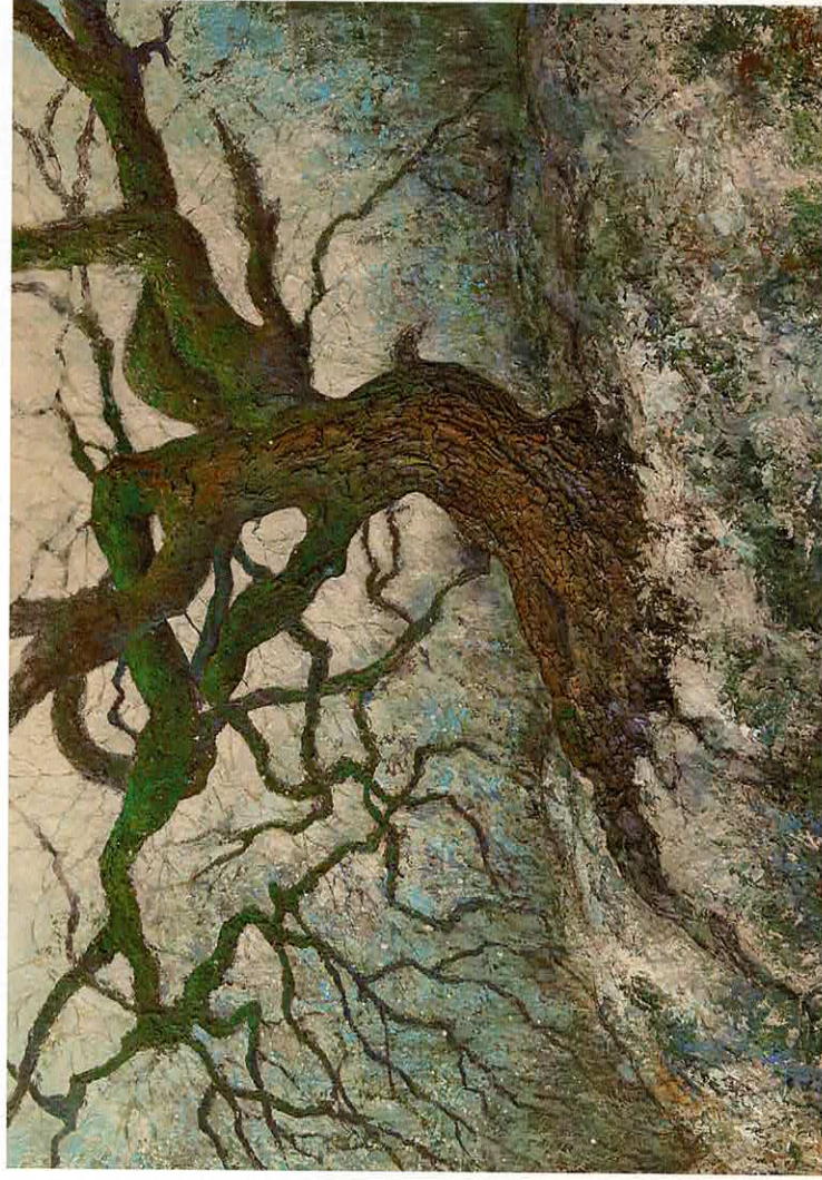
La force de la nature au Rocher Canon, 162 x 114 cm