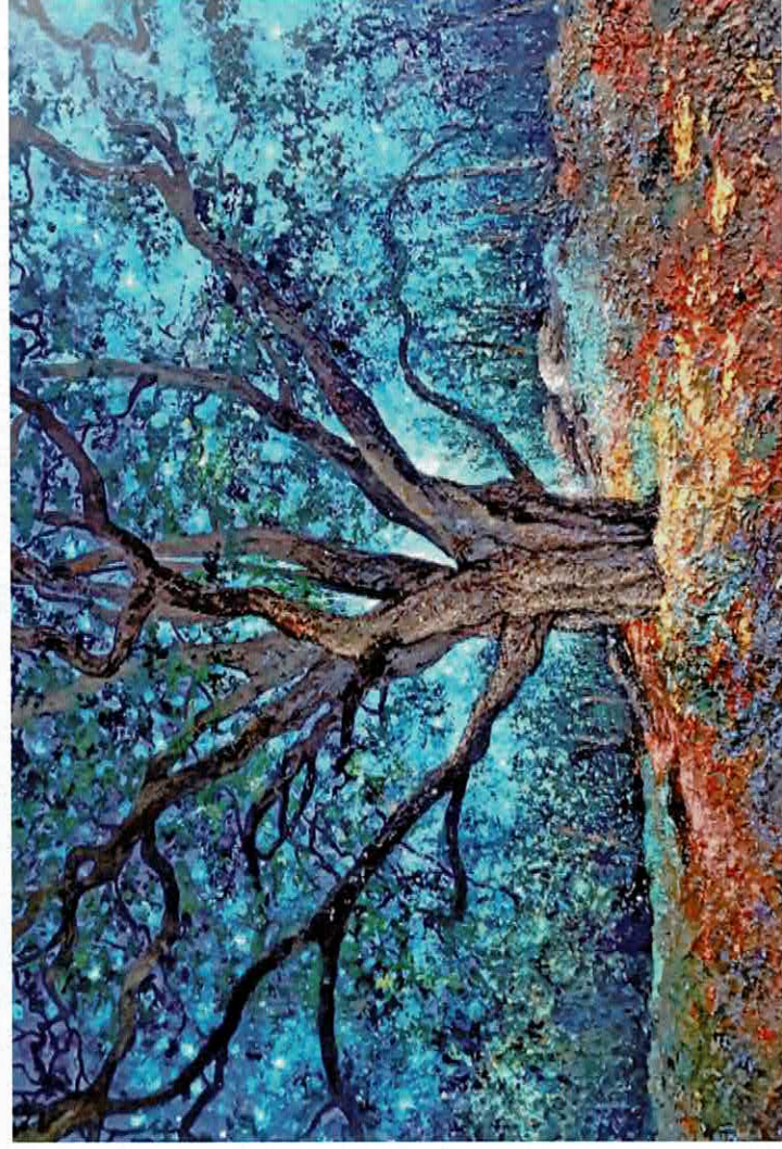
Symphonie nocturne : le Bouquet de la reine Amélie, 146 x 97 cm

Je n'ai qu'une envie, c'est de revenir... ■