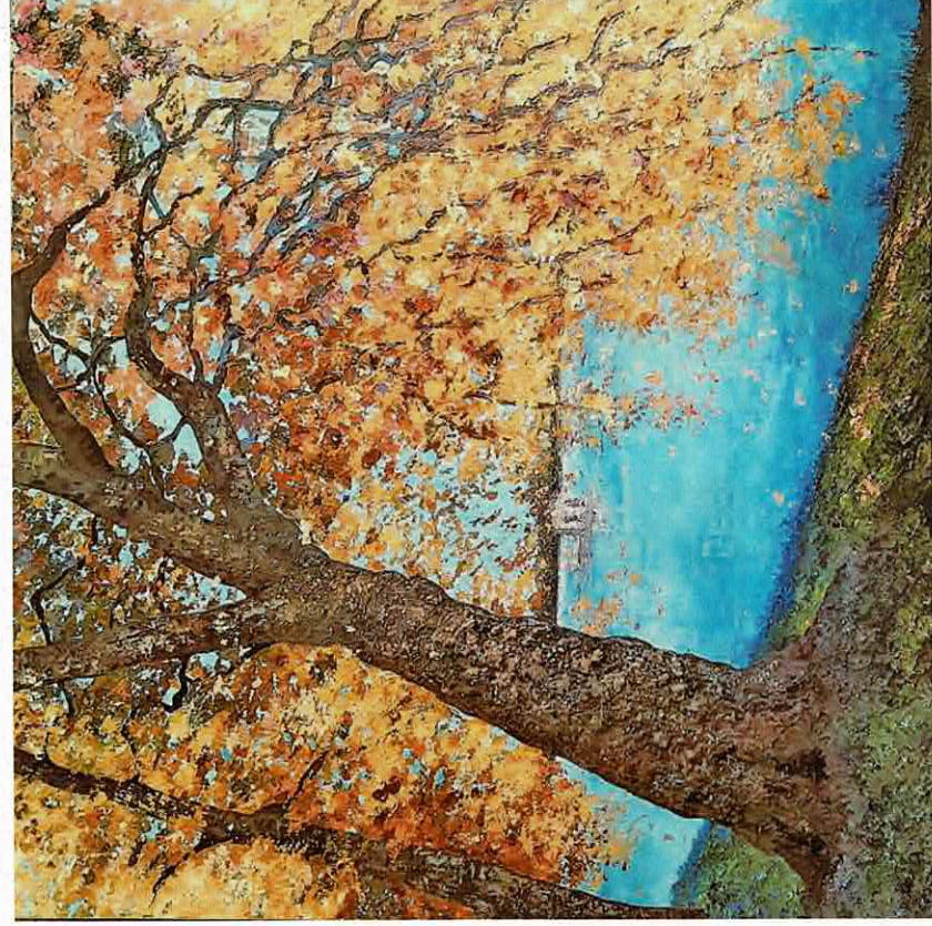
Balade romantique près de l'Étang aux Carpes, 120 x 120 cm

Dans toutes ces périodes, les arbres sont présents.