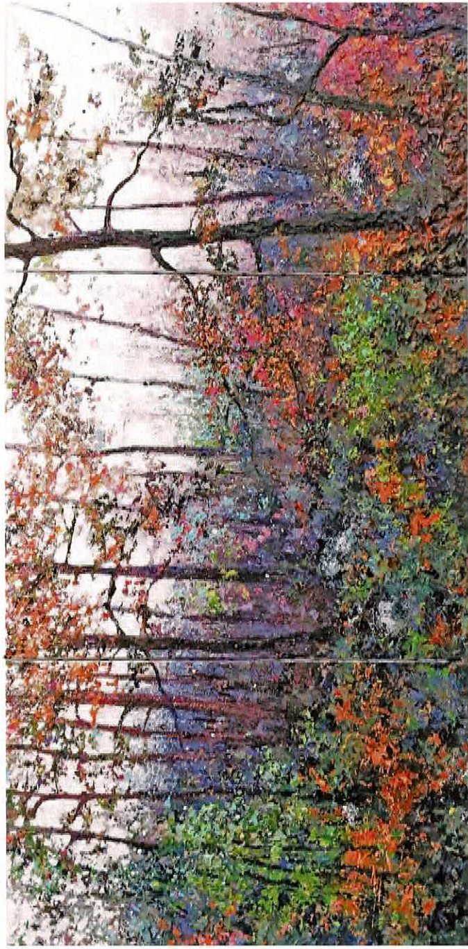
Féerie Fontainebleau, triptyque, 126 x 61 cm