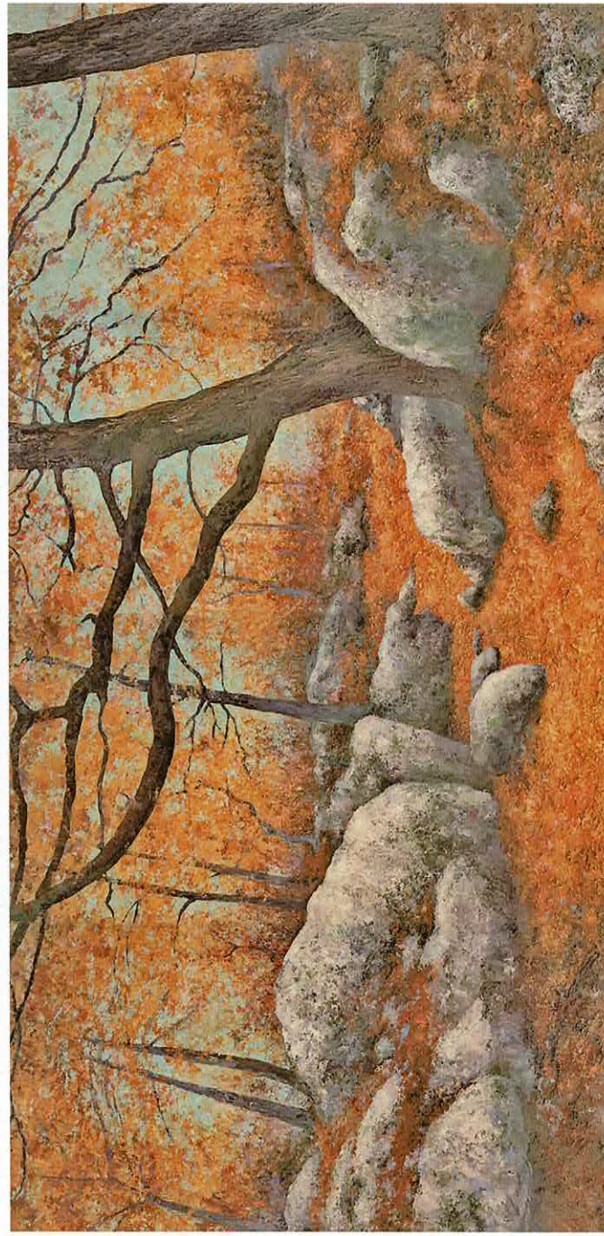
En forêt de Fontainebleau, quadriptyque, 400 x 200 cm