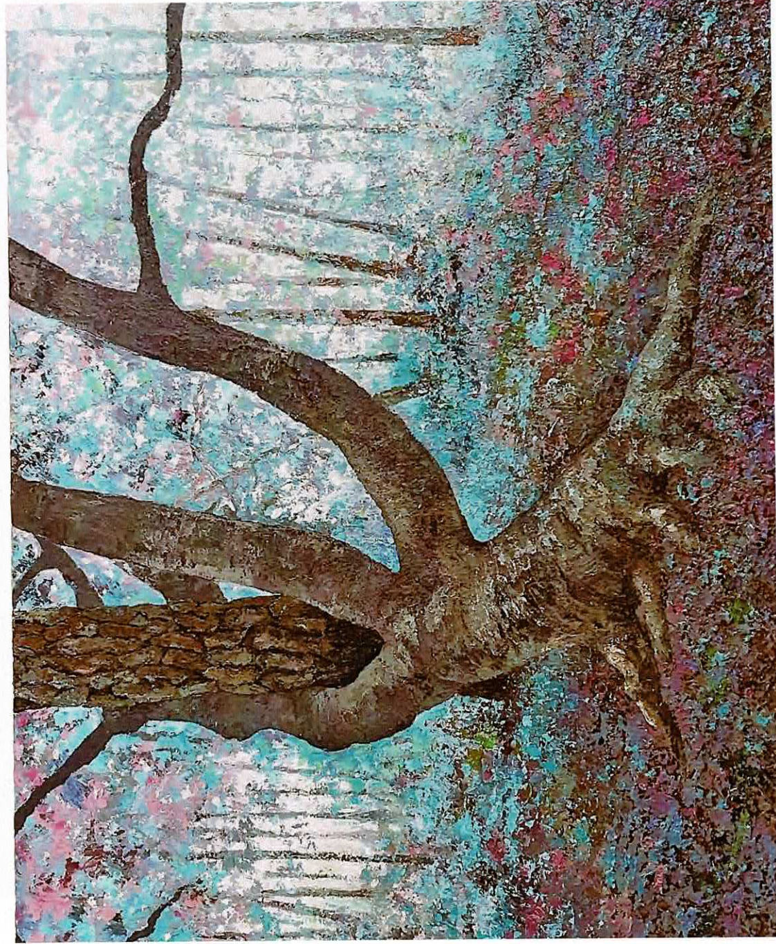
Arbres enlacés (hêtre et pin), 146 x 97 cm