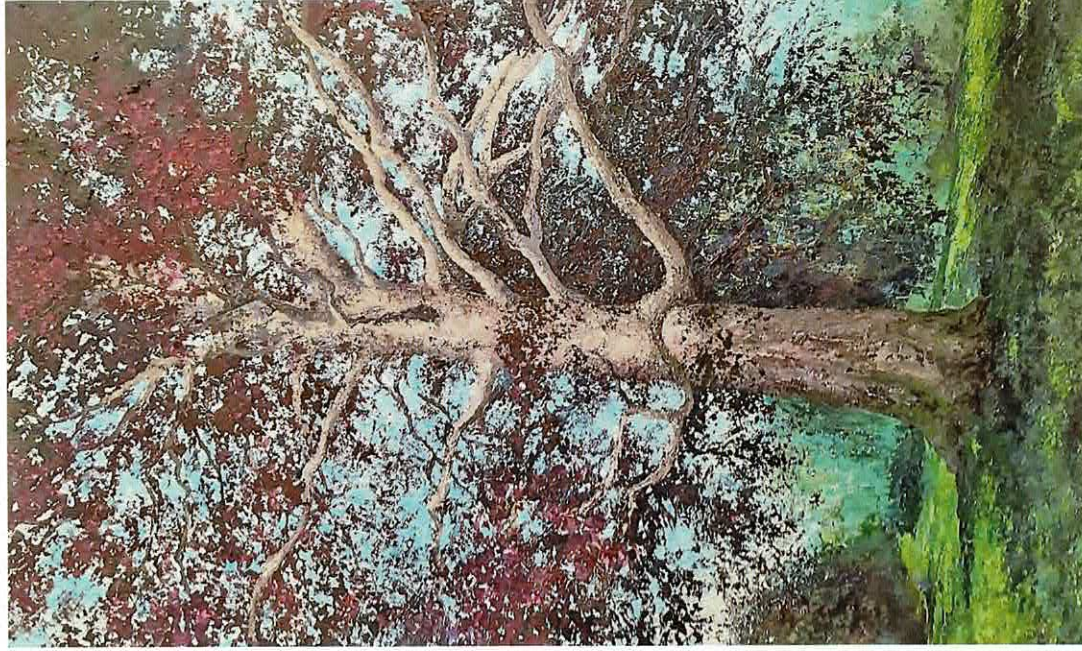
Grand hêtre pourpre, 162 x 97 cm