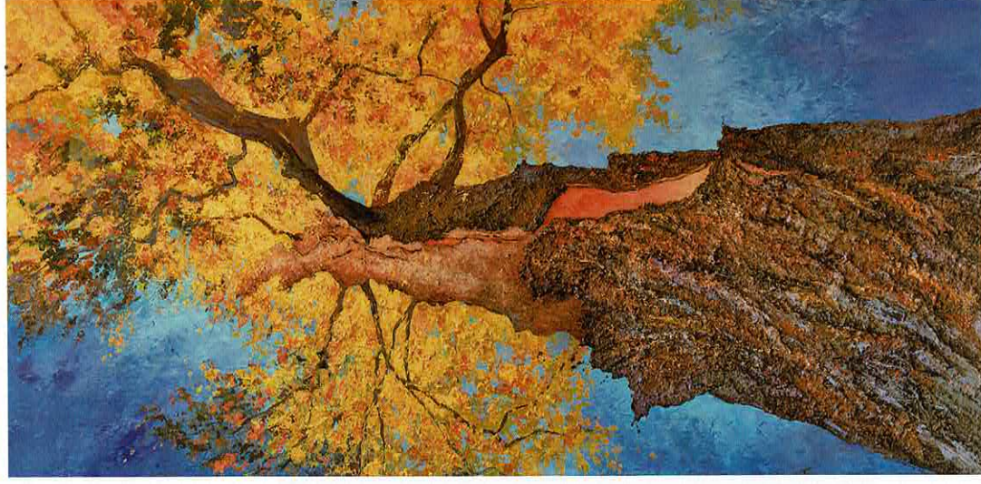
Tulipier foudroyé, 195 x 97 cm

Je suis donc partie à la rencontre de ces terres rêvées pour réaliser le portrait de ces arbres extraordinaires. La résidence s'est déroulée en trois parties : la première consis-