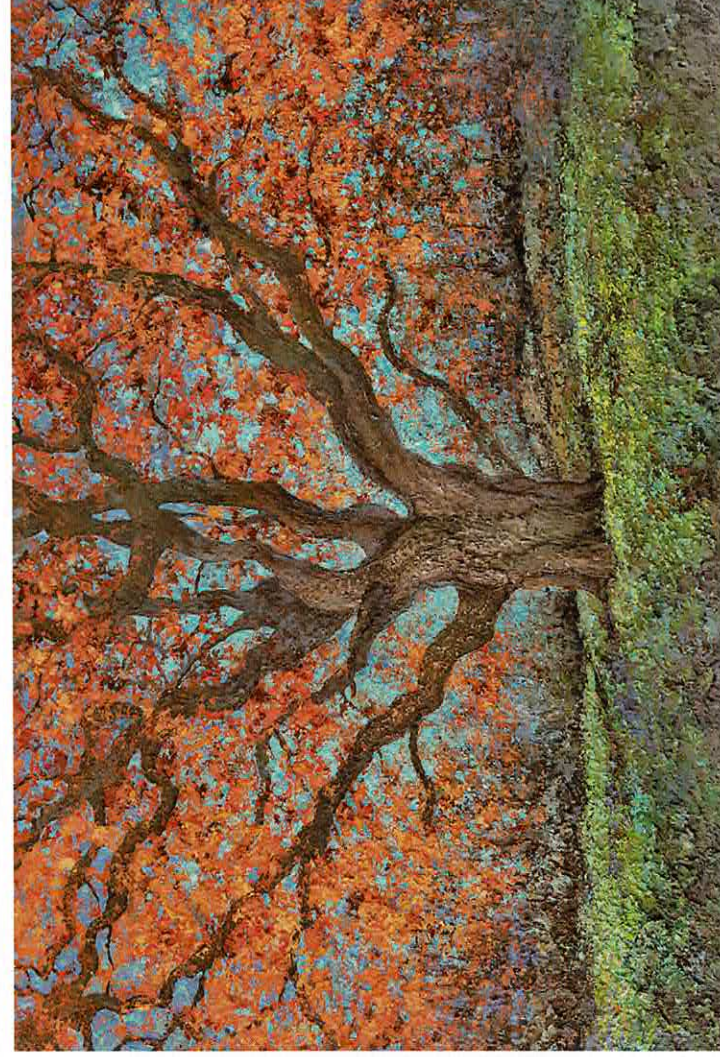
Le Bouquet de la reine Amélie en automne, 146 x 97 cm