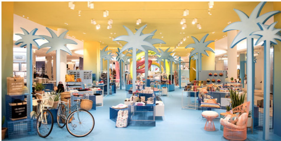
Exposition "Los Angeles Rive Gauche" au Bon Marché

"Los Angeles Rive Gauche" jusqu'au 21 octobre. Le Bon Marché Rive Gauche . 24, rue de Sèvres.