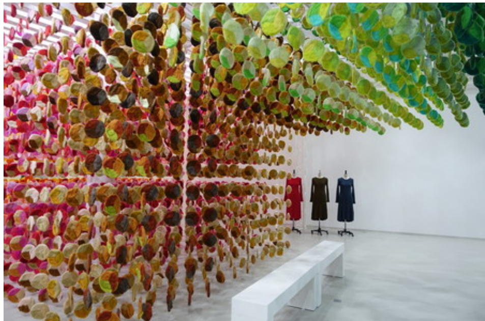
Affiche de l'exposition « L'Art et la Science de LifeWear : Les Nouveaux Standards de la Maille »

"L'Art et la Science de LifeWear : Les Nouveaux Standards de la Maille" du 26 au 29 septembre 2018. Entrée gratuite. 11h-19h. Galerie Nationale du Jeu de Paume, 1 place de la Concorde.