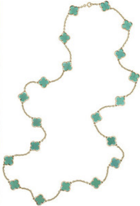
Sautoir Alhambra © Courtesy of Van Cleef & Arpels