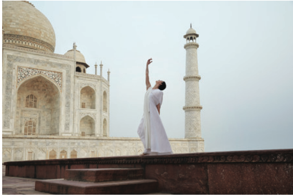
Détail de l'affiche "Etoile de Lune" pour l'exposition de Mossi Traoré

"Etoile de Lune" jusqu'au 11 octobre 2018. Le Carrousel du Louvre.