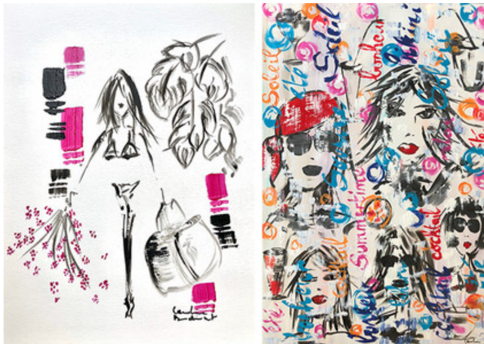
Exposition "Un rien m'habille" de Caroline Burdinat à la boutique Lise Charmel Saint-Germain © Caroline Burdinat

"Un rien m'habille" de Caroline Burdinat du 28 septembre au 27 octobre 2018. Espace Lise Charmel. 7 rue du Cherche-Midi.