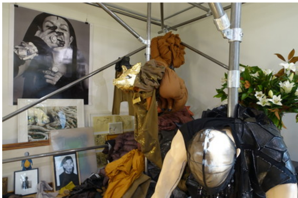
Michèle Lamy

"Lamyland at Joyce Gallery. Forever young" jusqu'au 2 octobre 2018. De 14h30 à 18h30. Joyce Gallery . 168, Galerie de Valois. Jardin du Palais Royal.