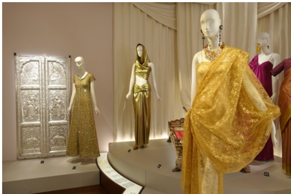
Exposition "L'Asie rêvée d'Yves Saint Laurent", sa vision de l'Inde