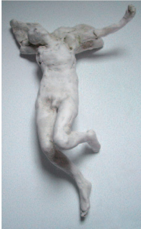
Ange musicien, 1999 Plâtre, hauteur 25 cm