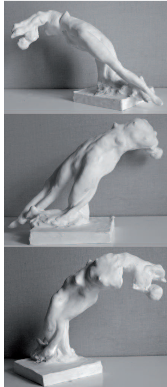
Pluie océanique, 1999 Plâtre, hauteur 25 cm