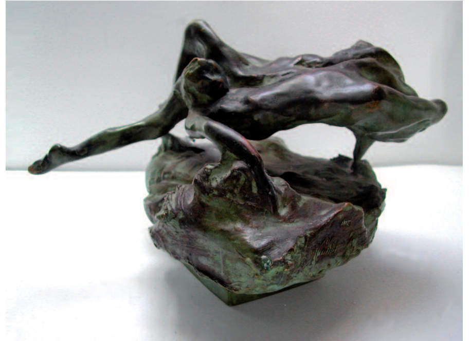
Nuée, 1999 Bronze, patine verte, hauteur 18 cm