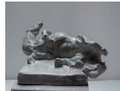
Cheval du temps, 2010 Béton fibré, 27 x 25 x 12 cm