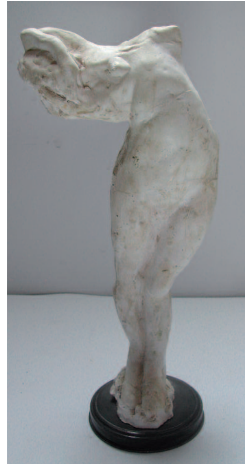
Petite pluie de printemps, 1995 Plâtre, hauteur 26 cm