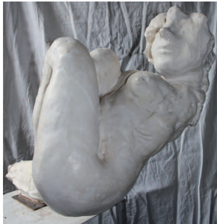
Sirène, 1999 Plâtre, hauteur 60 cm