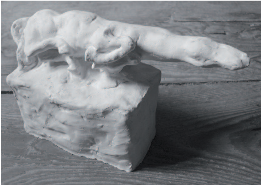
Cheval du temps, 2007 Plâtre, longueur 22 cm