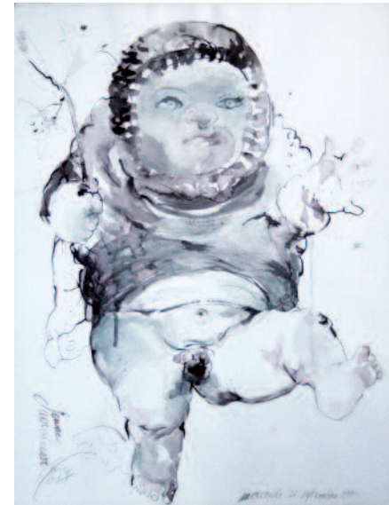
Jeune aviateur dessin au lavis, 50 x 75 cm