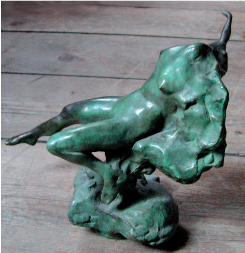
Petite pluie d'été, 1996 Bronze, hauteur 23 cm