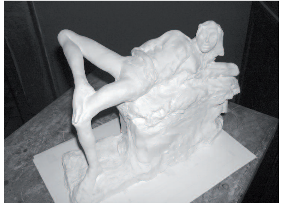
Canapé slave, Série des «Portraits en pied», 2007 Plâtre, hauteur 25 cm