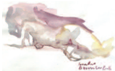
Nu Aquarelle, 13.5 x 21 cm