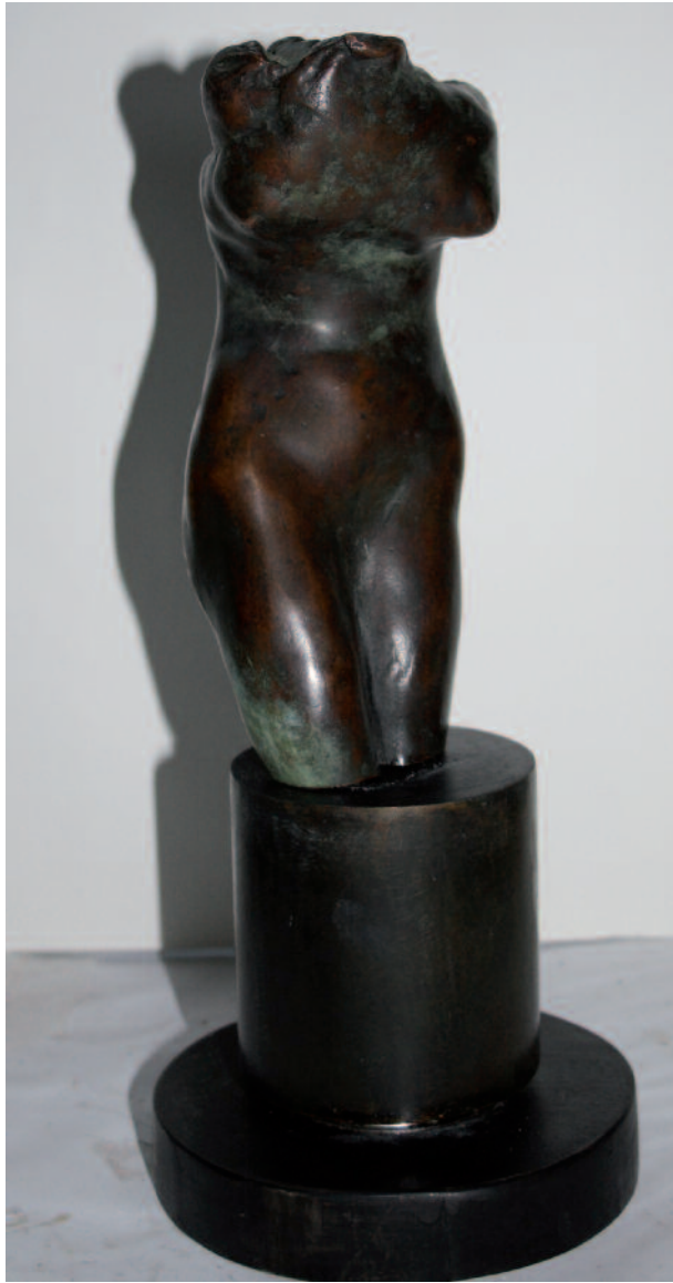
Nuit, 2009 Bronze, hauteur 16 cm