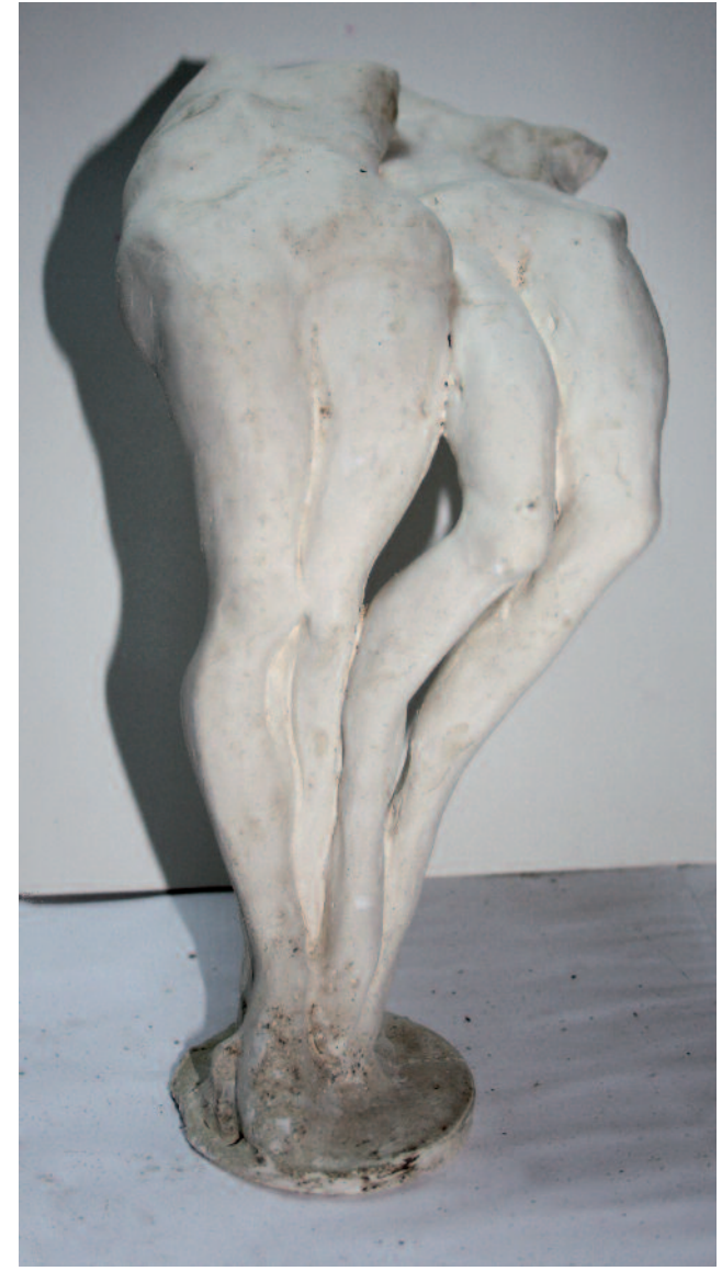
Nuage de pluie