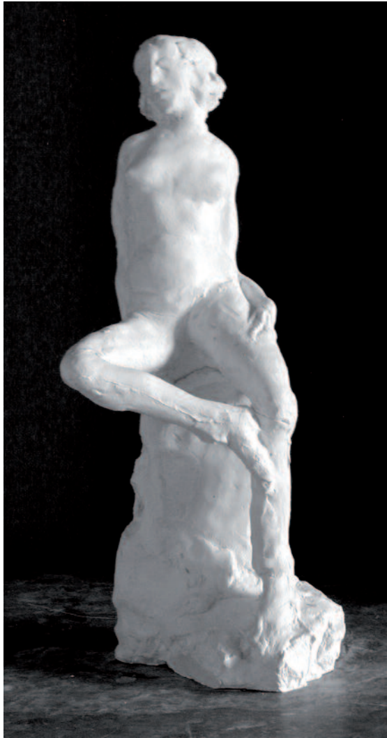
Baigneuses sixties, Série des «Portraits en pied» Plâtre, hauteur 30 cm