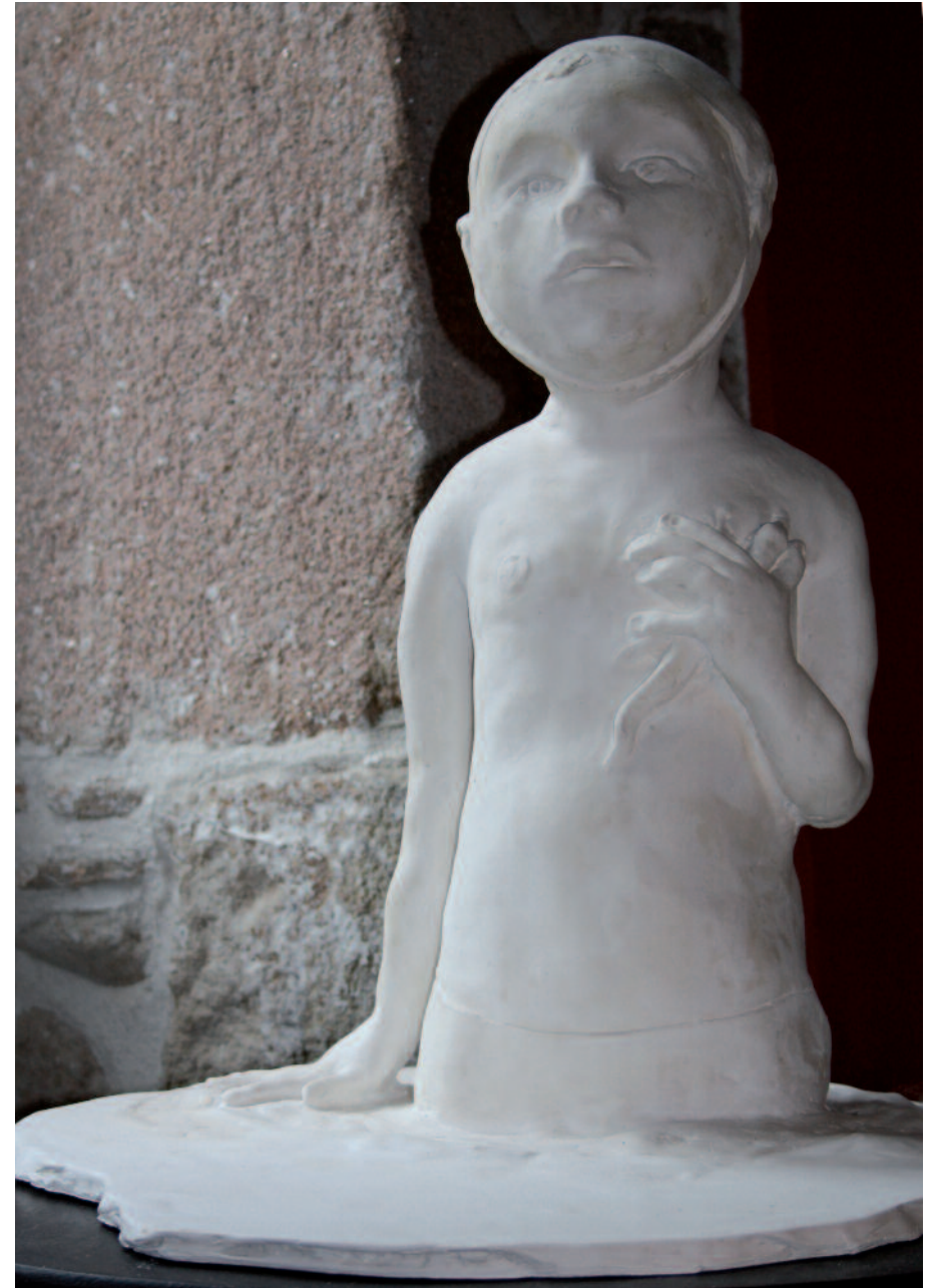
Petite baigneuse, 2009 Plâtre, hauteur 60 cm