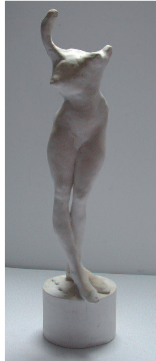
Tauromachie, 2000 Plâtre, hauteur 38 cm