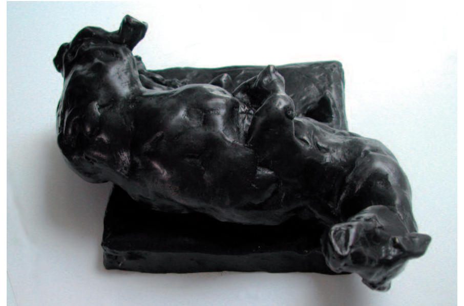
Cheval du temps, 2009 Bronze, patine noire