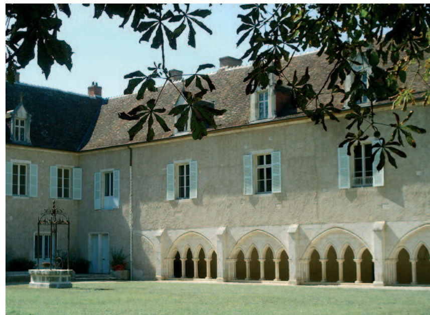
L'abbaye de La Prée, résidence internationale d'artistes, sous l'égide de l'association Pour Que l'Esprit Vive, appartient à l'association les petits frères des Pauvres. Pour Que l'Esprit Vive est partenaire de l'Académie des Beaux-Arts de l'Institut de France.