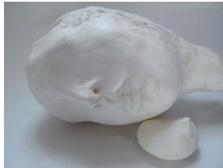
Nouvelle Eulalie, 2008 Plâtre, longueur 35 cm