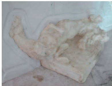
Cheval du temps, 2007 Plâtre dans sa gangue d'élastomère