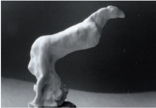
Centaure, série des «nuages», 1999 Plâtre, hauteur 22 cm