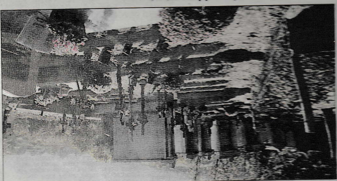
Un amebere toujours bien entretenu.