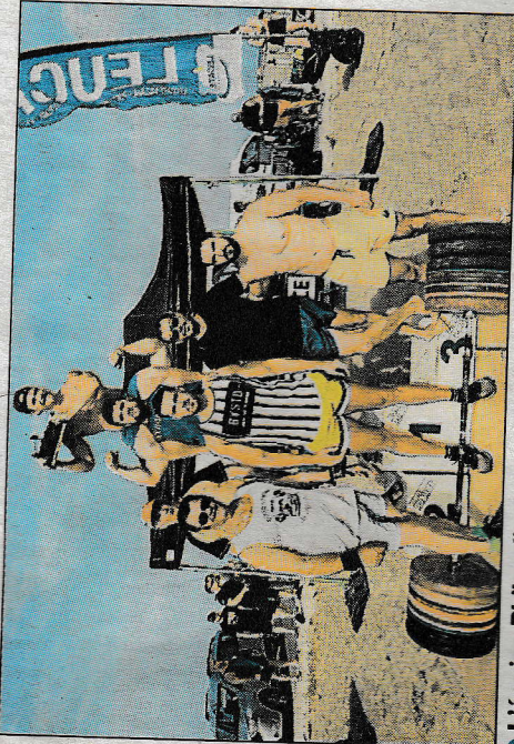
► L'équipe Philocalie de Port-La Nouvelle avec le trophée du meilleur tonnage soulevé.

► Pour plus d'informations, contacter Bernard au 04 68 41 05 63.