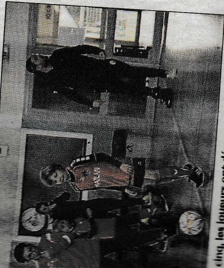
Cinq, les joueurs ont démontré de belles choses.