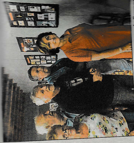
Le maire et quelques visiteurs lors de l'exposition.

Demain retrouvez l'exposition de voitures de collection. Le rassemblement des véhicules se fera dès 10 heures au village avec l'accueil des participants place Gonzales. Parés de leurs plus beaux atours, ces objets d'art se défilent dans les