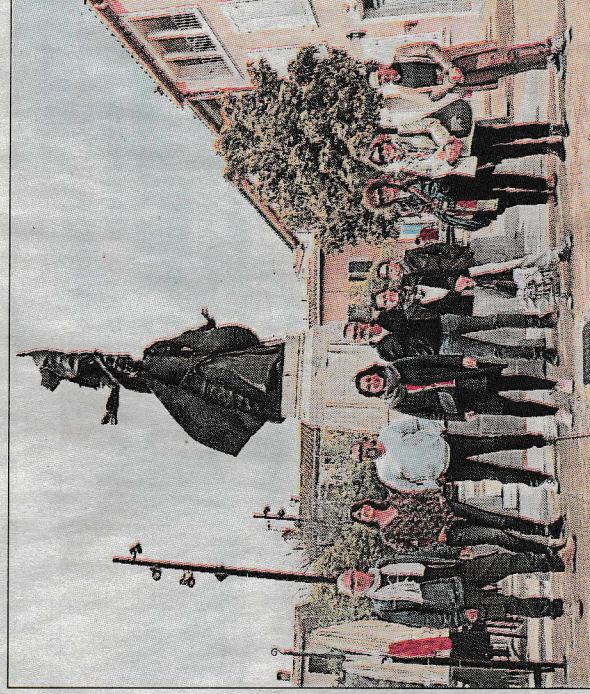
Les artistes leucatois sont à l'initiative de ce nouveau concept.

L'objectif est de faire connaître, valoriser et promouvoir la culture artistique locale, en incitant les gens, qu'ils soient des amateurs ou des curieux, à se rendre dans divers lieux. Et quoi de mieux que de conjuguer petite promenade et découverte d'ateliers d'artistes, parfois méconnus, qui pourront ainsi présenter leur travail et leurs créations originales, tout en faisant découvrir