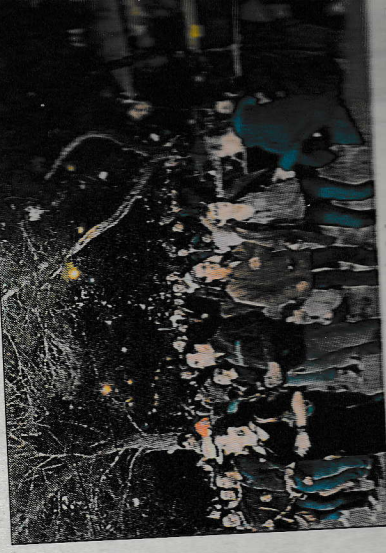
Ils étaient bien sous la pinède.

En ce week-end de juin, tout était au rendez-vous pour que cette soirée organisée par l'Association Culturelle Garriguo, soit une réussite. Même la tramontane qui a pourtant bien soufflé ce soir-là, n'a pas empêché les amateurs de musique de se rendre dans le petit bosquet attenant à la salle polyvalente pour assister au milieu de l'après-midi.