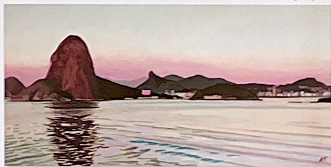
Arrivée au petit jour

Avec plus de 200 toiles à son actif, principalement peintes à l'huile car il considère que c'est le meilleur moyen pour avoir des couleurs légères et atteindre la nuance juste par couches successives.