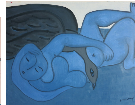
LEDA ET SWAN - HUILE 2018

... ET DU 15 JUN AU 22 SEPTEMBRE 2018 EXPOSITION DES OEUVRES VALIDANT LE DIPLOME DES METIERS D'ART AU LYCÉE DES METIERS D'ART ET DE L'AMEUBLEMENT