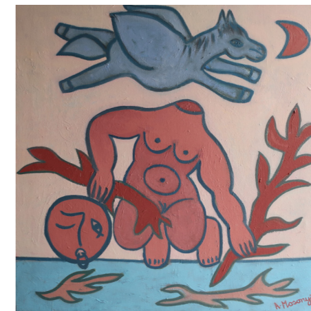
LA NAISSANCE DU CORAIL - HUILE 2018