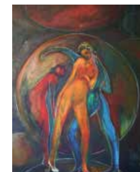
Les danseurs de lumière, 2010, 100x80cm, acrylique sur toile

Léonie Sommer's art is an ode to resilience, this capacity hidden in all of us and that allows us to move forward, hope and envisage life with strength and optimism.