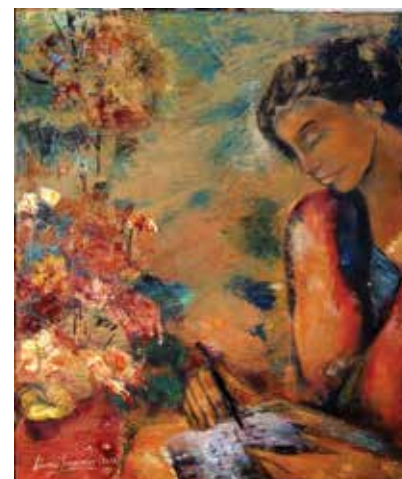
Lettres d'amour, 2014, 56x46cm, huile sur toile

La peinture de Léonie Sommer est une ode à la résilience, à cette capacité tapie en chacun de nous d'aller de l'avant, d'espérer, d'envisager la vie avec force et optimisme.