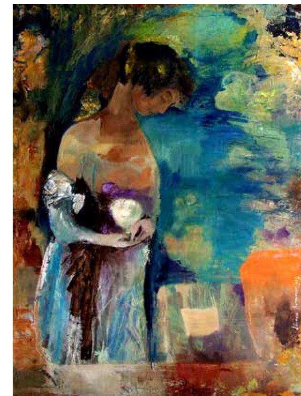
Au sortir de la nuit, 2008, 90x70 cm, huile sur toile