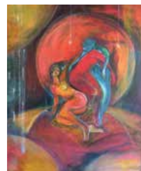
Les danseurs de soleil, 2010, 55x46 cm, acrylique sur toile

L'artiste a d'ailleurs créé l'association Cœur d'Ours pour favoriser l'épanouissement des personnes grâce à l'art !