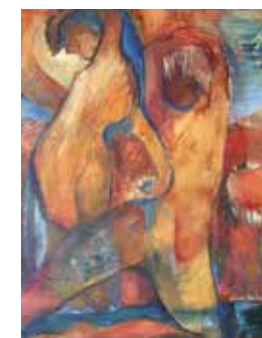
Tourmesols, 2011, 80x60cm, acrylique sur toile