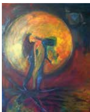
L'Astre solaire, Collection «les danseurs de lumière», 2010, 73x60 cm acrylique sur toile