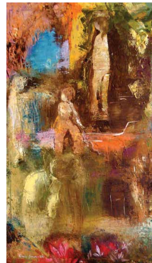
La baigneuse aux longs cheveux, 2007, 56x94.5 cm, huile sur toile