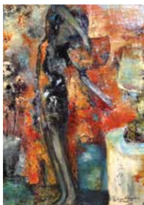
Passion, 2014, 70x50 cm, huile sur toile

LE LANGAGE DE LA COULEUR • THE LANGUAGE OF COLOUR