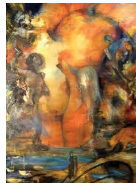
Tous les matins du monde, 2015, 90x70 cm, huile sur toile

The artist launched a charity, Cœur d'Ours, which encourages the development of persons through the means of art.